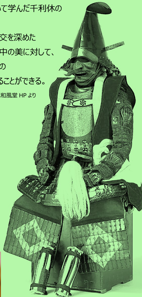
大阪夏の陣(1615年)で宗箇が着用した甲冑(かっちゅう) ; 上田流和風堂蔵