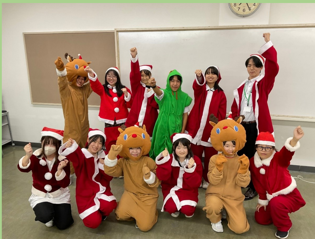
写真は今年のスタッフです。

【主催】サンタプロジェクト2024 実行委員会、(公財) 広島市文化財団 広島市青少年センター 広島市こども未来局