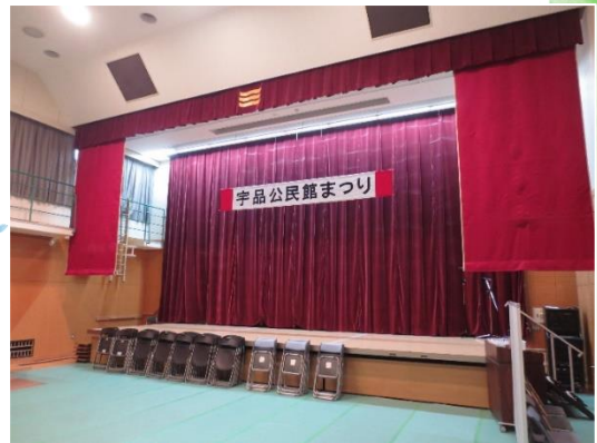
宇品公民館ホール（本事業では長尺シートは敷きません。）

わかものたちを中心としたグループ発表会 Young Summer Festa in Ujina を初開催♪ 宇品公民館のホールステージで、ダンス・音楽・神楽などのパフォーマンスをしてみませんか？ 詳しくは、募集要項等をご確認ください。 たくさんのご応募をお待ちしています。